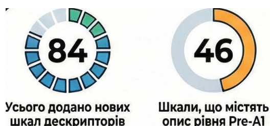
Рис. 2. Кількісний аналіз нових шкал CEFR Companion Volume (2020)

Водночас описані дескриптори цього рівня дають змогу педагогам ефективніше планувати заняття, оцінювати успіхи учнів, адаптувати навчальні матеріали та будувати індивідуальні освітні траєкторії для здобувачів із різним стартовим рівнем володіння мовою. Візуальна, жести й стандартизована підтримка виступає важливим ресурсом для формування елементарної комунікативної компетентності в період переходу до рівня A1.