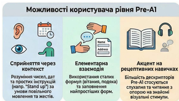
Рис. 1. Можливості користувача на рівні Pre-A1

Зазначається, що до характеристик дескрипторів рівня Pre-A1 належать так само стислість висловлювання, наявність підтримки, повільний темп мовлення, чіткість, а також повторюваність окремих слів і комунікативних формул [8]. Наприклад, загальний дескриптор усного сприймання на рівні Pre-A1 передбачає здатність «розпізнавати числа, ціни, дати та дні тижня за умови, що мовлення подається повільно й чітко у визначеному, знайомому повсякденному контексті» [8, с. 48]. Аналогічно, дескриптор загальної письмової продукції на рівні Pre-A1 зазначає, що учні «можуть повідомляти базову особисту інформацію (наприклад, ім'я, адресу, громадянство), за потреби, із використанням словника» [8, с. 66].