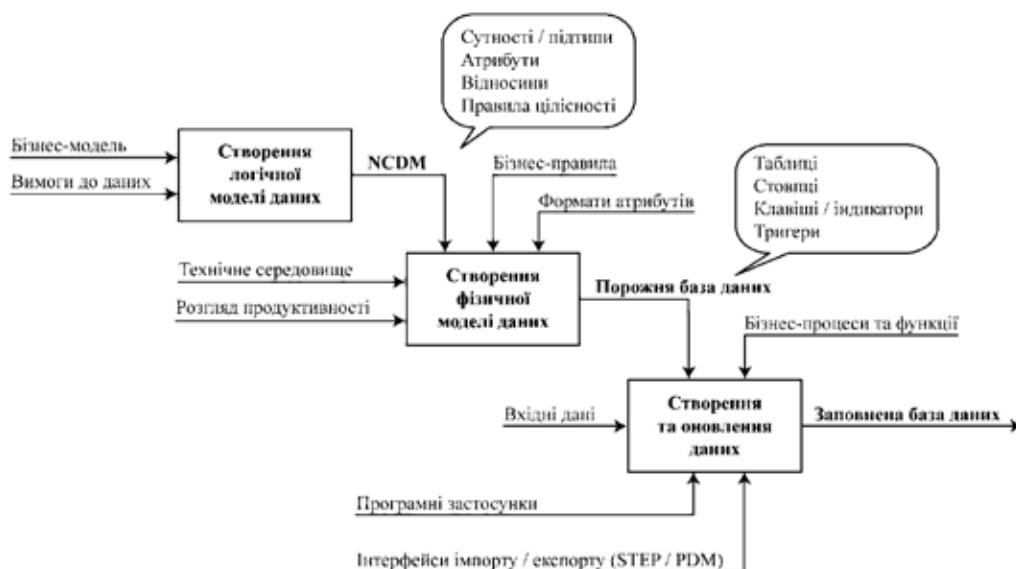
Рис. 2. Побудова IT-системи на основі NCDM [9]

Рис. 2 ілюструє дії, необхідні для побудови IT-системи на основі NCDM. Прямокутники на діаграмі представляють дії, які необхідно виконати; стрілки – компоненти системи, які повинні бути доступні для виконання дій. Створюючи NCDM, основний компонент системи, перша дія завершується. Всі інші компоненти засновані на NCDM, але не менш важливі. Реалізація NCDM зіткнеться з необхідністю розроблення таких компонентів, як бізнес-правила, керівництво зі впровадження, визначення формату атрибутів і розроблення програмного забезпечення [9].